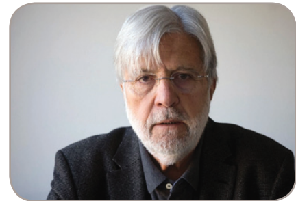
Eloy Sánchez Rosillo

Eloy Sánchez Rosillo (Murcia, 1948). Con poemas plenos de emoción y sentido, transparentes y hondos, ha ido creciendo una obra con la que se ha consolidado como uno de los poetas fundamentales de la poesía española de las últimas décadas. Ha publicado diez libros de poemas: Maneras de estar solo (Madrid, 1978, Premio Adonais 1977), Páginas de un diario (Barcelona, 1981), Elegías (Madrid, 1984), Autorretratos (Barcelona, 1989), La vida (Barcelona, 1996), La certeza (Barcelona, 2005, Premio Nacional de la Crítica ), Oír la luz (Barcelona, 2008), Sueño del origen (Barcelona, 2011) Antes del nombre (Barcelona, 2013) y Quién lo diría (Barcelona, 2015). Todos ellos, revisados y en edición definitiva, han sido reunidos recientemente por Tusquets Editores en Las cosas como fueron. Poesía completa, 1974-2017 (Barcelona, 2018).